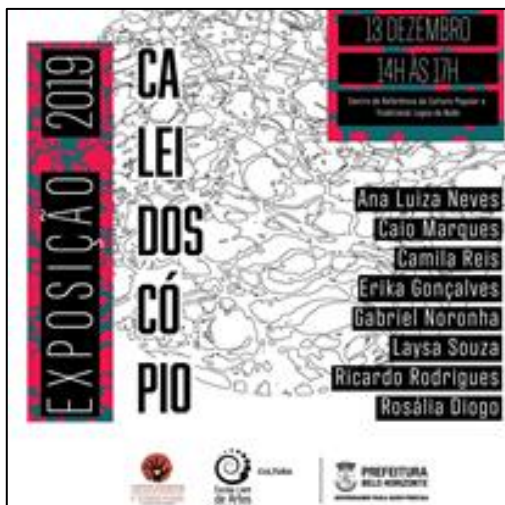
Figuras 5: Cartaz de divulgação da Exposição “Caleidoscópio”. Dezembro, 2019.