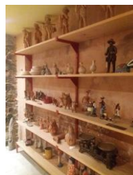
Figura 2, 3 e 4 - Visita à Chácara Santa Eulália, Acervo Priscila e Alberto Freire. Dezembro, 2019. Arquivo pessoal. .