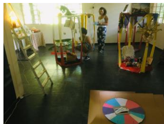
Figuras 7 e 8 - Mediação com os alunos na Exposição “Caleidoscópio”. Dezembro, 2019.