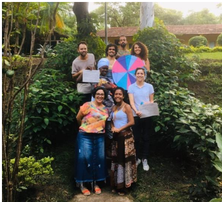
Figura 9 – Entrega dos certificados e finalização do curso. Dezembro, 2019.