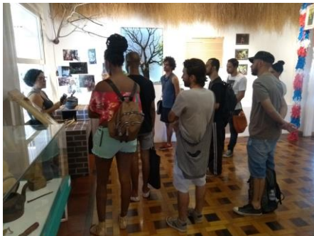
Figura 1 - Visita à exposição temporária “Quilombos Urbanos”, no Centro de Referência da Cultura Popular e Tradicional Lagoa do Nado. Outubro, 2019.