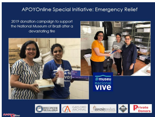
Doação de materiais de preservação ao Museu Nacional do Brasil, 2019

Mais recentemente, em 2019, uma nova campanha de doação de materiais de preservação foi realizada, desta vez para auxiliar nas ações de resgate e recuperação das coleções do Museu Nacional do Brasil, cujo acervo foi praticamente destruído por um incêndio no final de 2018. Dentre os patrocinadores que generosamente contribuíram para este projeto encontram-se University Products, Gaylord Archival, Hollinger Metal Edge, National Postal Museum, Museum of Fine Arts, Boston, The American Institute for Conservation, Bookmakers International Ltd, RISD Museum (Museum of Art Rhode Island School of Design), restauradores e patrocinadores privados.