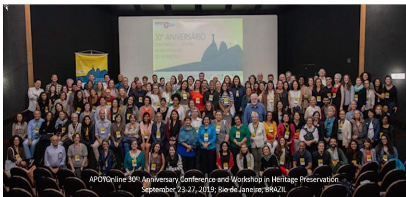
Foto dos participantes da Conferência de 30 anos da APOYOnline, 2019

Em regiões de grandes desigualdades sociais, econômicas, ambientais e culturais, como a América Latina e o Caribe, o trabalho de redes de partilha faz-se ainda mais vital para potencializar os esforços realizados com o objetivo da valorização de culturas, ancestralidades e patrimônios, gerando o empoderamento dos profissionais dedicados e engajados nestas tarefas e de instituições e empresas que colaboram nestas atividades.