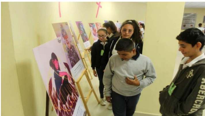
Ilustración 5: Estudiantes en la exposición, Gral. Terán

Curso: las ilustraciones estaban por todas partes, después de la conferencia hubo un refrigerio y se dejó el espacio abierto para que las personas pudieran navegar libremente y contemplar los paneles, el tiempo y el trayecto que siguieran quedaba a su elección.