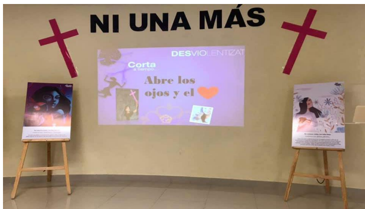
Ilustración 6: Presentación Abre los ojos y el corazón

el COVID-19 las fechas en que estas acciones sucederán están pendientes.