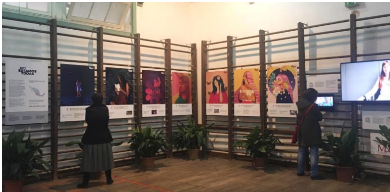
Ilustración 3: Exposición Lisboa

Esta exposición es una protesta colectiva de distintas artistas visuales, defensoras de derechos humanos, víctimas de violencia y personas cercanas a la causa varias para denunciar feminicidios y transfeminicidios, explica también las formas en que cruelmente son retratados.