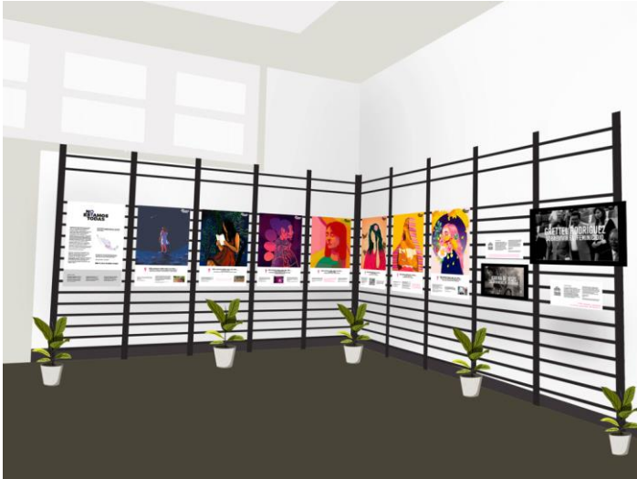
Ilustración 1: Maqueta de exposición Lisboa