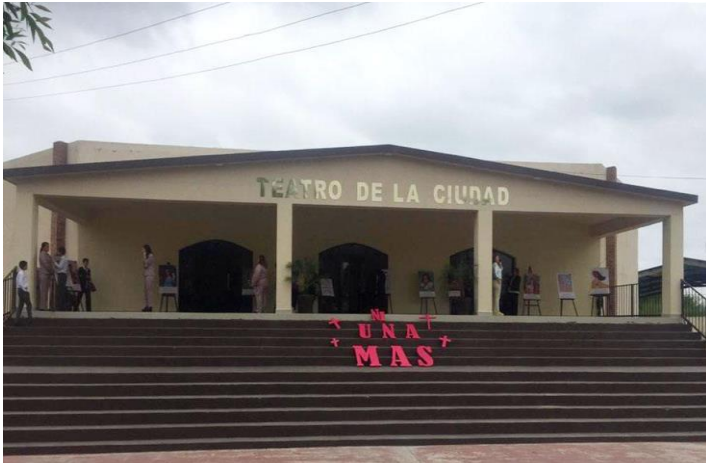
Ilustración 4: Teatro de la ciudad de Gral. Terán

Dany ya que su familia había sido invitada y que la exposición terminará con la ilustración de Isabel que en ese momento era el feminicidio más reciente ilustrado.